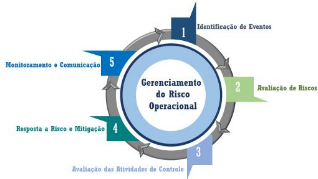
Diagrama 1 - Abrangência do Gerenciamento do Risco Operacional